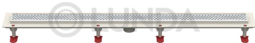
Рис. 2 – Решетка тип А – «Волна»

Механический «сухой» затвор представляет собой пружинную конструкцию с плотно прижатой к корпусу мембраной, которая предотвращает проникновение неприятных запахов в помещение. Механический затвор также препятствует обратному ходу стоков при засоре канализационных магистралей (максимальное рабочее давление обратного тока сточных вод - 0,005 МПа).