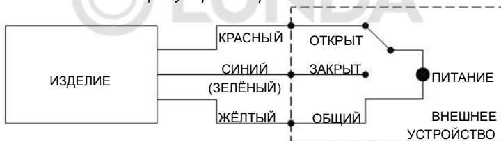
Рисунок 2. Схема подключения изделия.