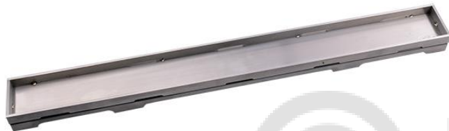
Рис. 4. Решетка HL0531I.

6.3. HL0531I – серия «Индивидуальная», решетка из нержавеющей стали с матовой поверхностью. Данная решетка предназначена для вклеивания в неё мозаики или облицовочной напольной плитки толщиной до 12 мм (включая плиточный клей)