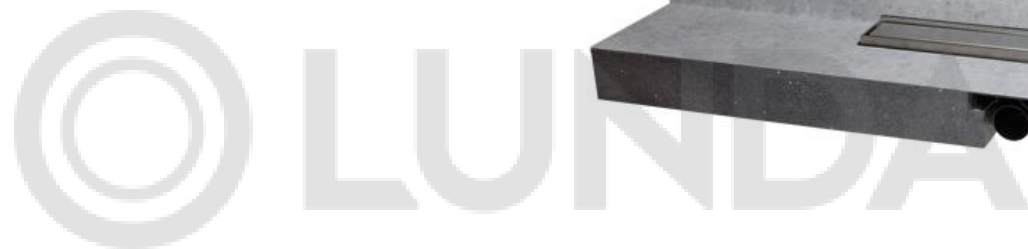
Душевой лоток HL531