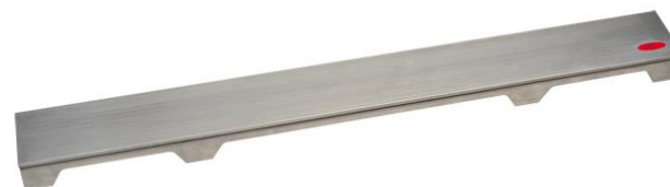
Рис. 3. Решетка HL0531D.