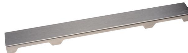
Рис. 2. Решетка HL0531S.

Данная решетка подходит для напольной плитки толщиной до 13 мм (включая плиточный клей)