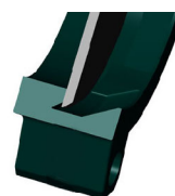
Уплотнение металл / металл