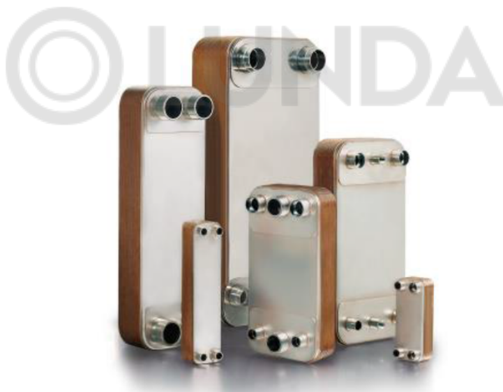
Внешний вид теплообменников пластинчатых типа МРНЕ серии С

Теплообменники пластинчатые типа МРНЕ серии С предназначены для передачи тепловой энергии от одного теплоносителя к другому. Теплообменники пластинчатые типа МРНЕ серии С могут применяться в холодильных установках (компрессорных, абсорбционных), а также в тепловых насосах. В качестве рабочих сред могут использоваться негорючие хладагенты (фторуглероды, хлорфторуглероды, CO 2 ), технические и холодильные масла, вода для технических нужд и систем ГВС, спиртосодержащие растворы.