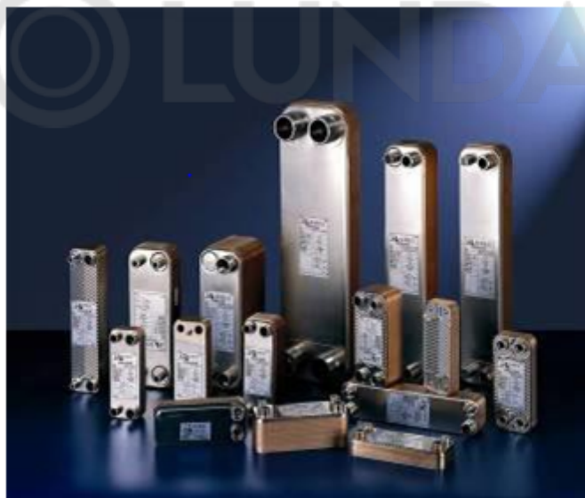
Внешний вид теплообменников пластинчатых типа ВРНЕ

Теплообменники пластинчатые типа ВРНЕ предназначены для передачи тепловой энергии от одного теплоносителя к другому. Теплообменники пластинчатые типа ВРНЕ могут применяться в холодильных установках (компрессорных, абсорбционных), а также в тепловых насосах. В качестве рабочих сред могут использоваться негорючие хладагенты (фторуглеводороды, хлорфторуглеводороды, аммиак, CO 2 ), технические и холодильные масла, вода для технических нужд и систем ГВС, спиртосодержащие растворы.