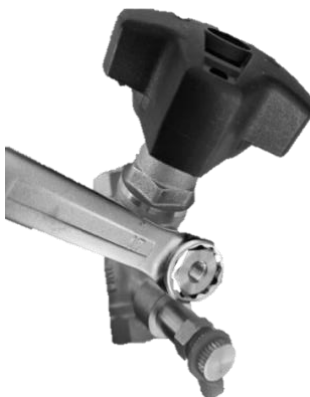
Клапан с адаптером для АРТ