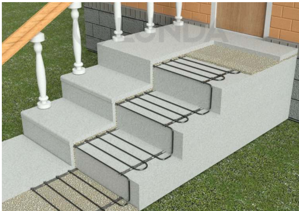
Рис. 3. Обогрев ступеней на крыльце

При монтаже кабелей на ступенях (входные группы) необходимо учитывать дополнительную площадь теплоотдачи. В этом случае рекомендуется перейти на шаг укладки кабеля 7,5 см (на ступени стандартной ширины 300 мм монтируется четыре нитки кабеля). Кроме того необходимо при монтаже сдвигать крайнюю нитку кабеля на самый край бетонной заготовки для лучшего прогрева края ступени, см. рис. 3.