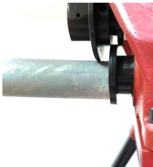
Рис. 2 Установка трубы