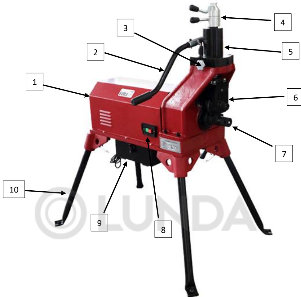
Рис. 1 Конструкция желобонакатного станка VOLL V-Groover