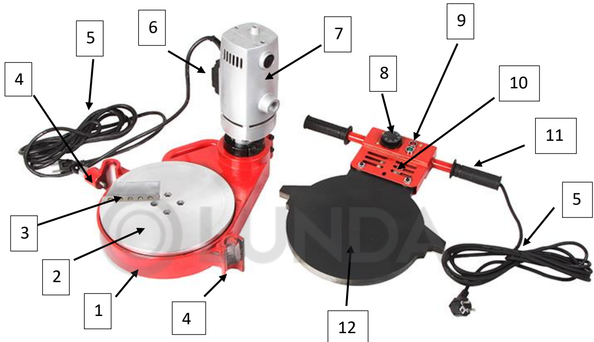
Рис. 2 Конструкция торцевателя и нагревателя