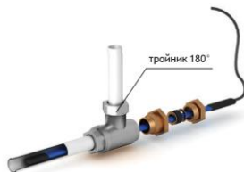
Рис. 2 - Схема прямого ввода нагревательной секции внутрь трубопровода