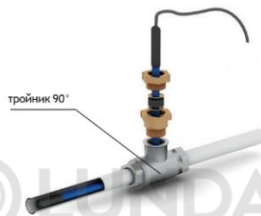
Рис. 3 - Схема ввода нагревательной секции внутрь трубопровода под углом 90°