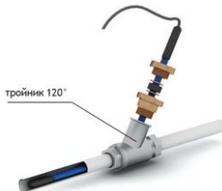
Рис. 4 - Схема ввода нагревательной секции внутрь трубопровода под углом 120°