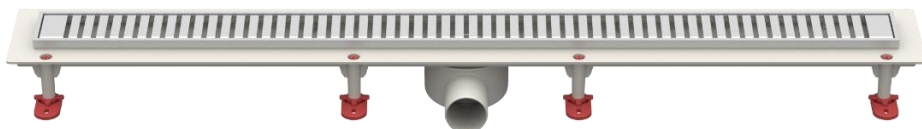
Рис.5 – Решетка тип D «Полосы»

Партия трапов, поставляемая в один адрес, комплектуется паспортом и объединенным техническим описанием в соответствии с ГОСТ 2.601-2006.