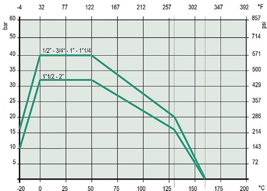
РИС.1.1. ЗАВИСИМОСТЬ РАБОЧЕГО ДАВЛЕНИЯ ОТ ТЕМПЕРАТУРЫ ПЕРЕМЕЩАЕМОЙ СРЕДЫ