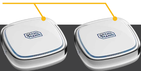
Датчик протечки воды Stahlmann R868 (до 50 шт)

Предназначена для интеграции модуля Stahlmann Smart в системы диспетчеризации жилых, административных и производственных зданий