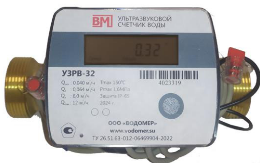
а) модификация УЗРВ DN от 15 до 40 мм (исполнение ППР – осевого типа) на примере УЗРВ-32

Общий вид счётчиков приведён на рисунке 1.