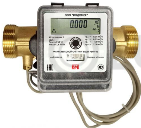
в) модификация УЗРВ-01 DN от 15 до 40 мм (исполнение ППР – осевого типа) на примере УЗРВ-01-32