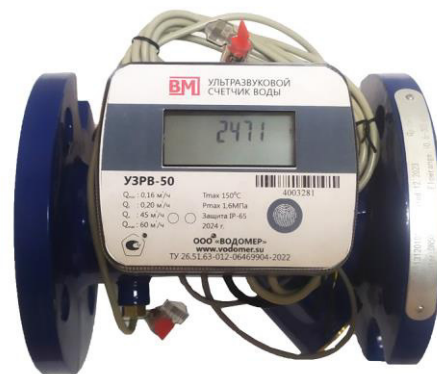
б) модификация УЗРВ DN от 50 до 250 мм (исполнение ППР – полнопроходное) на примере УЗРВ-50