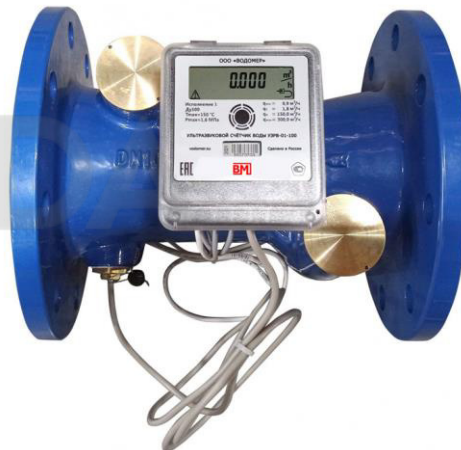
г) модификация УЗРВ DN от 50 до 200 мм (исполнение ППР – полнопроходное) на примере УЗРВ-01-100