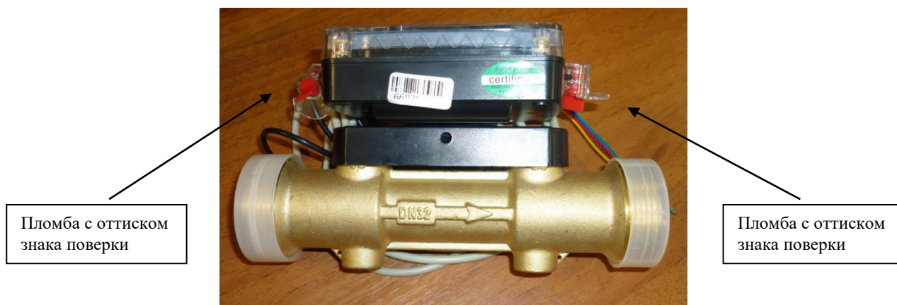
Рисунок 2 - Схема пломбировки от несанкционированного доступа, обозначение места нанесения знака поверки

Для предотвращения несанкционированного доступа пломбируется корпус ЭБ счётчика, для чего на нем конструкцией предусмотрены два ушка. Схема пломбировки счётчиков приведена на рисунке 2.