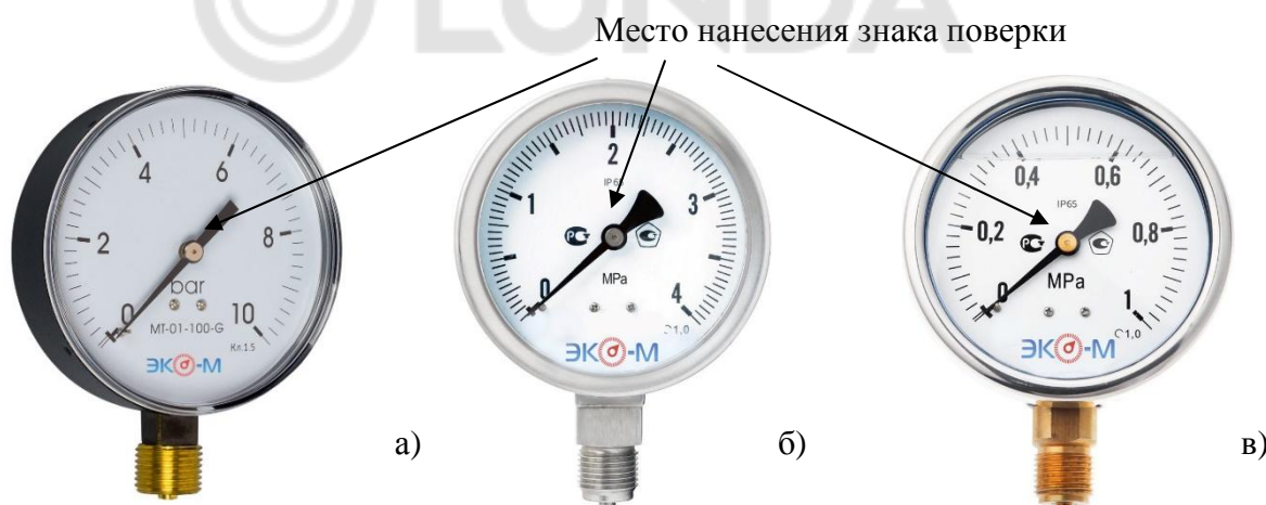
Рисунок 2 – Общий вид манометров, вакуумметров и мановакуумметров а) МД01 и МД02, б) МД90, в) МД93, обозначение места нанесения знака поверки