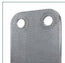
Инновационная конструкция, основанная на микроканальной технологии