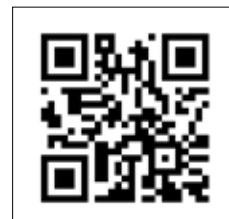
Для получения более подробной информации о технических характеристиках сканируйте QR код.