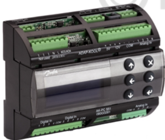
Рис. 1 Внешний вид контроллера

Контроллеры давления и температуры типа АК-РС модификации 551 выполнены в одном корпусе и могут иметь встроенный графический дисплей. Для настройки и отображения параметров к контроллерам можно подключить выносные дисплеи.