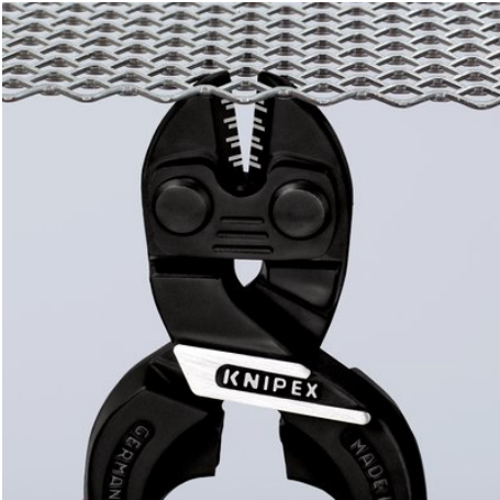
Тонкая головка для оптимального доступа к детали