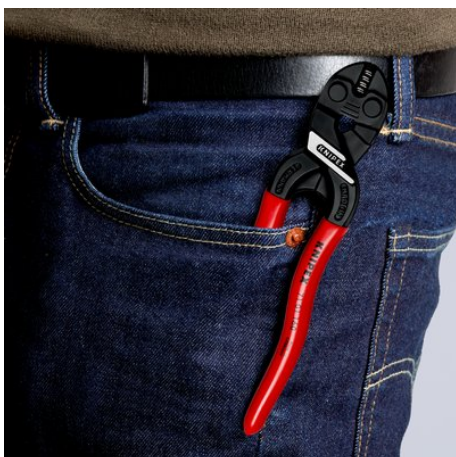
Компактный, лёгкий и всегда под рукой