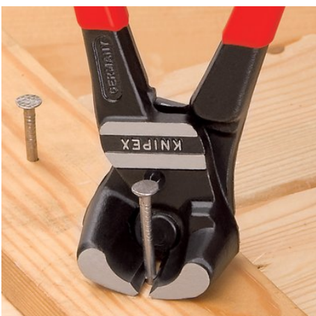
обрезка винтов, гвоздей и т.д. почти заподлицо