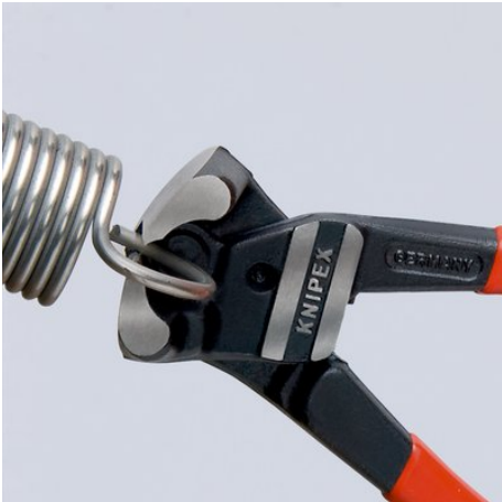
Высокая режущая способность: подходит даже для рояльной струны