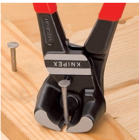
обрезка винтов, гвоздей и т.д. почти заподлицо