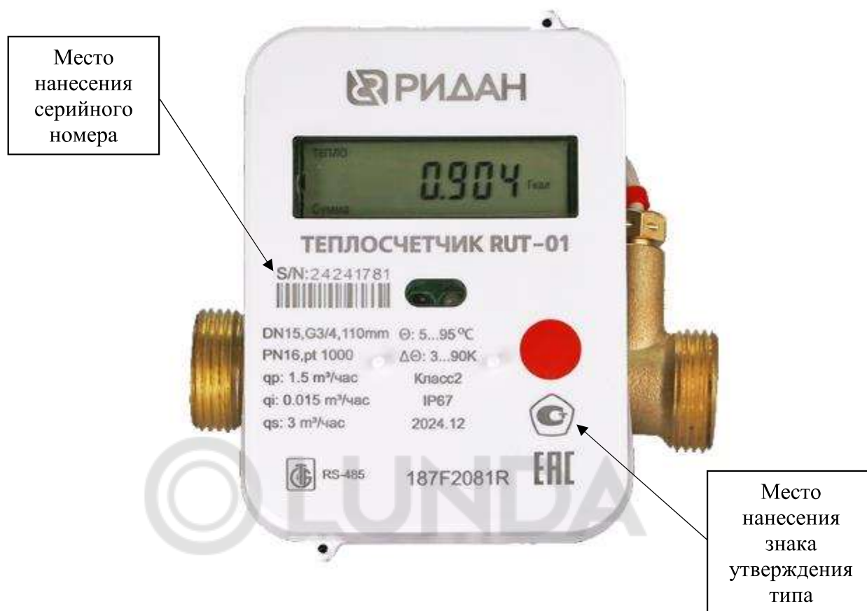
Рисунок 3 – Места нанесения заводского номера и знака утверждения типа средств измерений

Нанесение знака поверки на корпус средства измерений не предусмотрено.