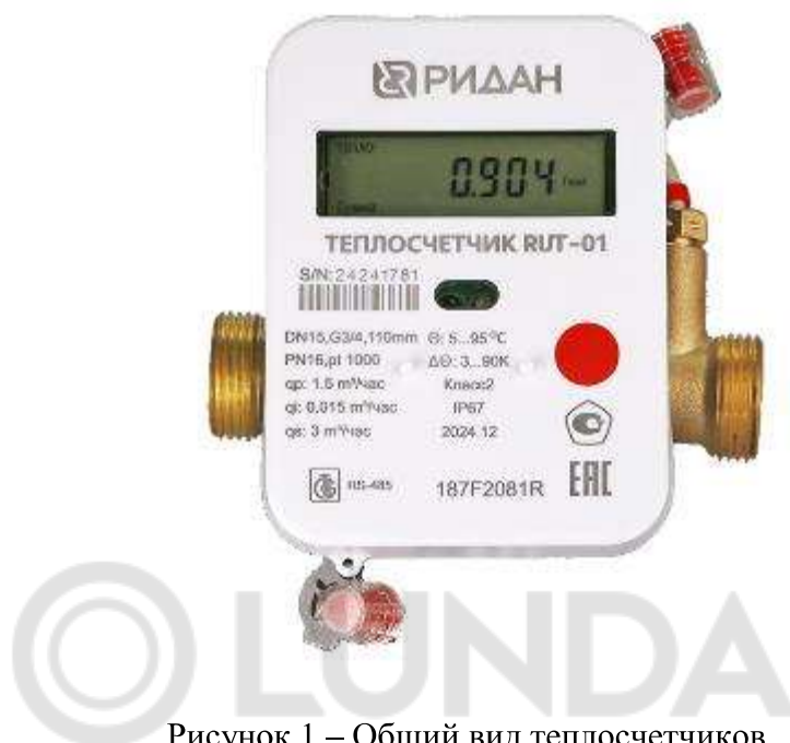
Рисунок 1 – Общий вид теплосчетчиков

Общий вид теплосчетчиков представлен на рисунке 1.