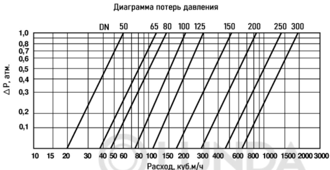
Диаграмма потерь давления в полностью открытом регуляторе

Потери давления при проходе рабочей среды через регулятор могут быть определены по диаграмме: