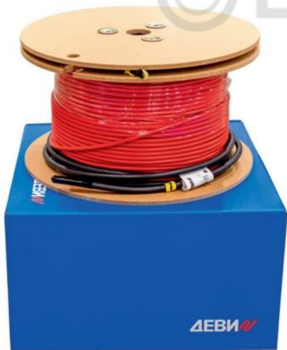
Рис. 1. Внешний вид нагревательного кабеля ДЕВИ Flex-10T на катушке и упаковочной коробки.

Нагревательный кабель ДЕВИ Flex-10T (Рис.1) применяется для внутренней и наружной установки. Кабель используется для полного отопления или комфортного подогрева поверхности пола при монтаже деревянных полов на лагах или ремонтируемых и тонких бетонных полов. В наружных установках используется для защиты от замерзания грунта под холодильными камерами и искусственными катками, а также для сопровождающего обогрева трубопроводов и обогрева уличных резервуаров.